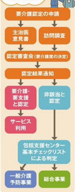
図1 介護認定手続きの流れ

名前は知っていても、どんなものであるのか意外と知らない人も多いのではないのでしょうか。いざというときに必要な介護保険制度の正しい知識を身につけ、備えておきましょう。